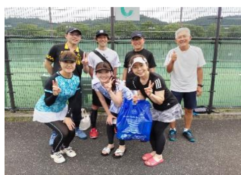
準優勝 Teamズータンズ