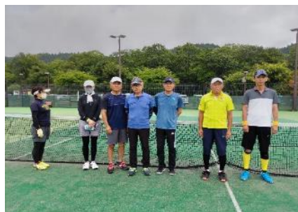
コンソレ優勝 今市クラブ